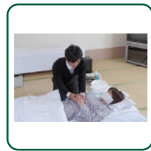
死化粧 湯灌納棺の儀