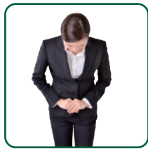
式場アシスタント