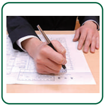
死亡届け手続き代行