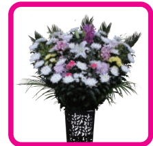
施主花 1対 (@12,960円)