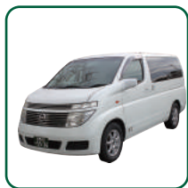
寝台車・霊柩車(20k迄)