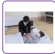
死化粧 湯灌納棺の儀