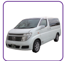
寝台車・霊柩車(20k迄)