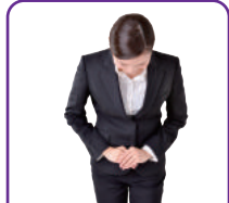
式場アシスタント