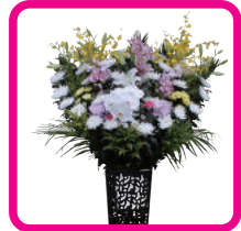
施主花 1対 (@16,200円)