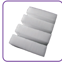
ドライアイス(2回分)