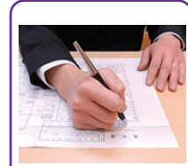
死亡届け手続き代行