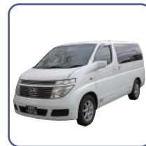
寝台車・霊柩車(20k迄)