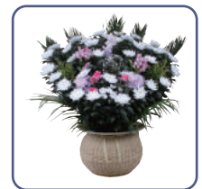
施主花 1対 (@12,960円)