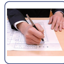
死亡届け手続き代行