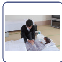
死化粧 湯灌納棺の儀