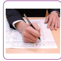
死亡届け手続き代行