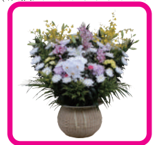
施主花 1対 (@16,200円)