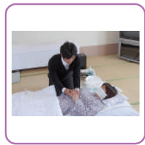
死化粧 湯灌納棺の儀