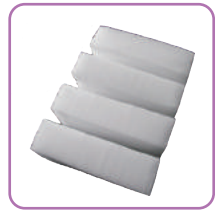
ドライアイス(2回分)