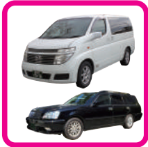
寝台車・霊柩車(20K迄)