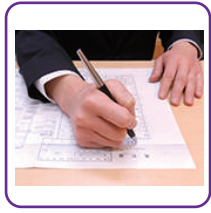
死亡届け手続き代行