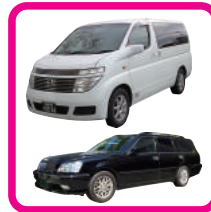
寝台車・霊柩車(20K迄)