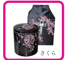
骨壺 (さくら又は友禅)