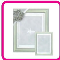
遺影写真 (照明写真)