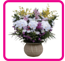
施主花 1対 (@21,600円)