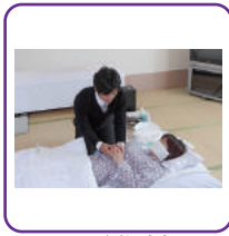
死化粧 湯灌納棺の儀