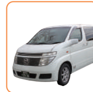
ご遺体搬送(20k迄) 霊柩車(20k迄)