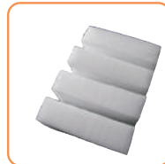
ドライアイス(1回分)