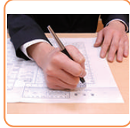
死亡届け手続き代行