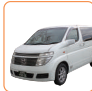
ご遺体搬送(20k迄) 霊柩車(20k迄)