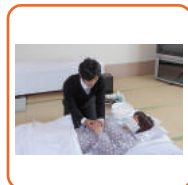
死化粧 湯灌納棺の儀