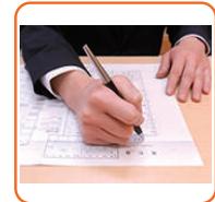
死亡届け手続き代行